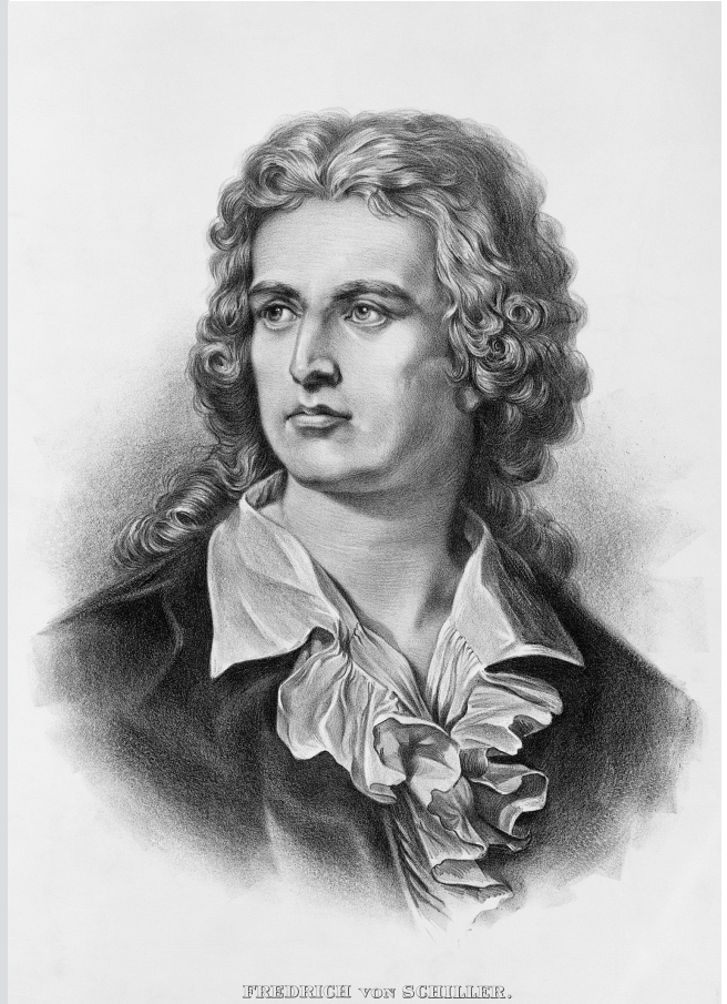
FRIEDRICH VON SCHILLER.