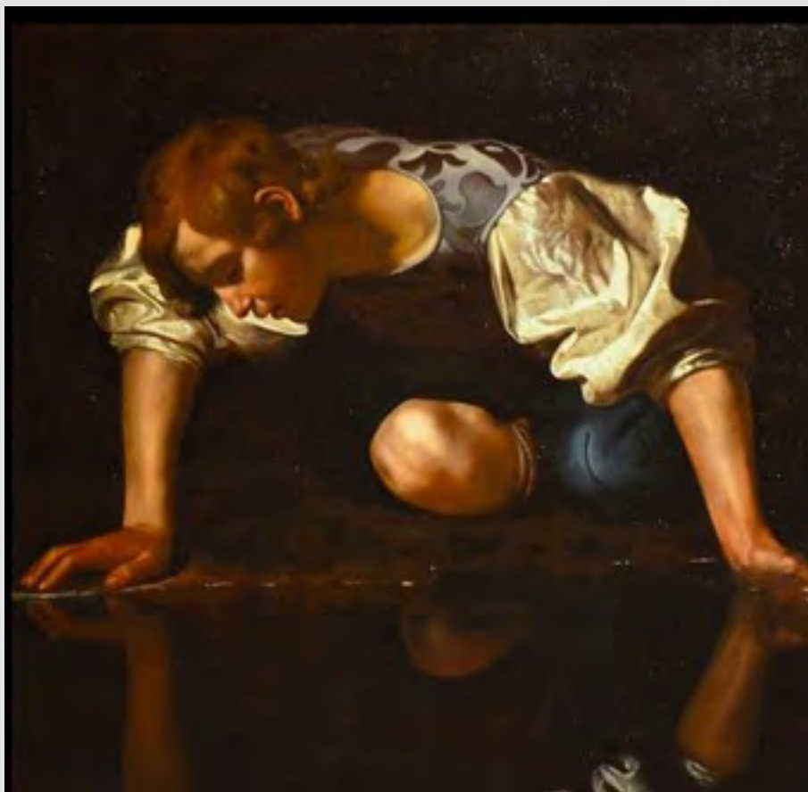
Narcisse, Le Caravage