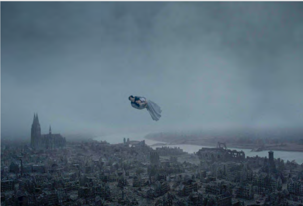
Pour l'Eternité, Roy Anderson

« La Joconde c'est la grâce, c'est un sourire éphémère. C'est ce sourire de la grâce qui fait l'union avec le chaos du paysage qui est derrière. Son sourire forme un pont d'un côté à l'autre. Du chaos on passe à la grâce et de la grâce on repassera au chaos. »