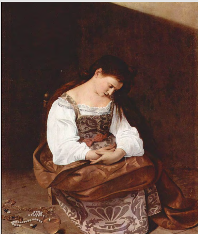
La madeleine repantante, Le Caravage