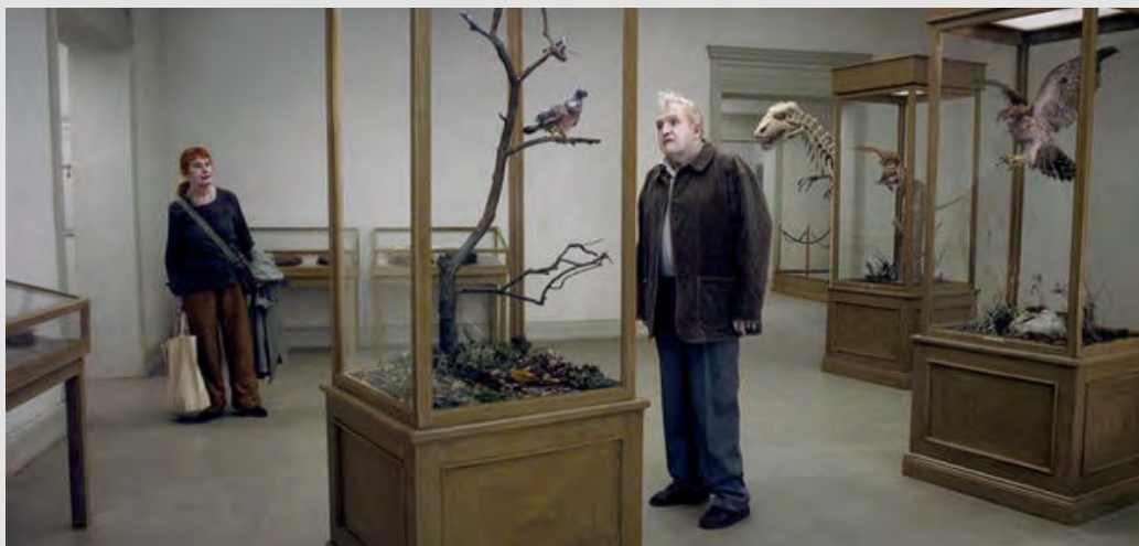
Un pigeon perché sur une branche philosophaît sur l'existence, Roy Anderson

Hors du temps, le cycle des répétitions historiques, tragiques et intimes, cesse. C'est grâce à ce suspens que ces errants, borders, voyous, faiseurs d'histoires, solitaires, campés à la périphérie d'un monde, sur une île vouée à disparaître, vont réenclencher un mouvement salvateur.