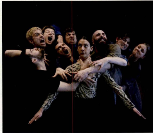
Tendre colère