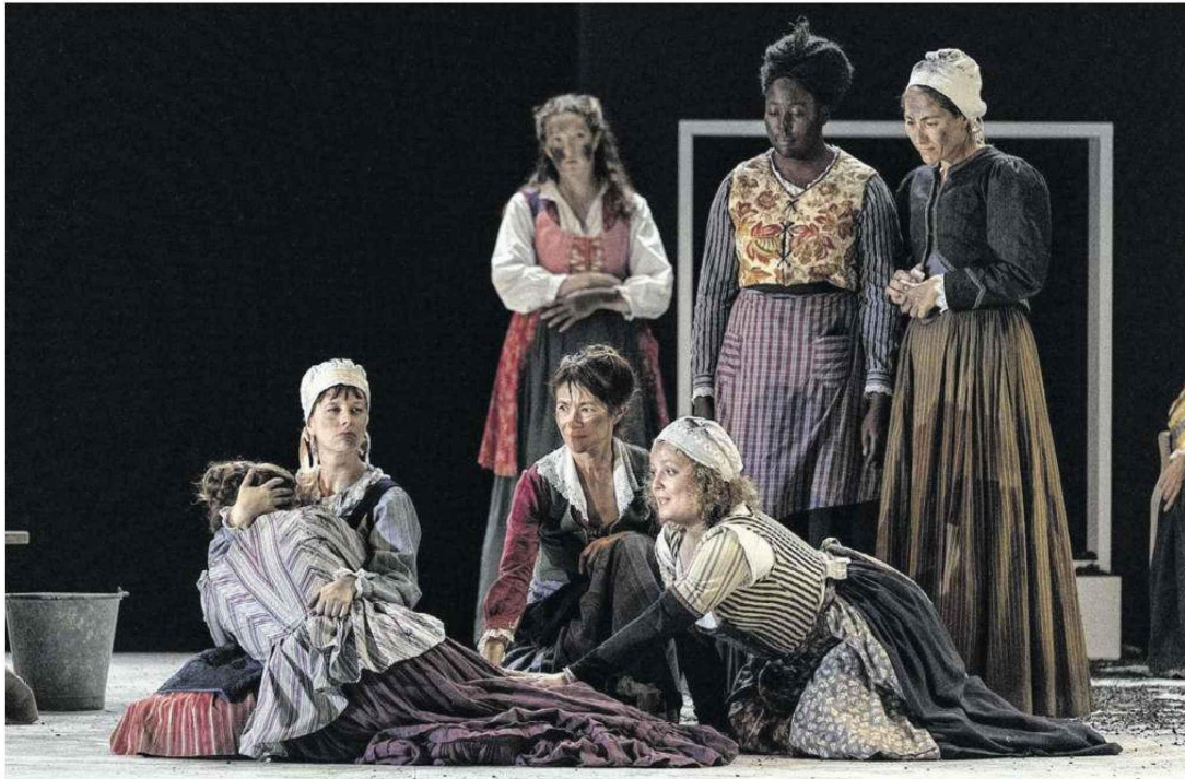
Le Firmament , une pièce de théâtre judiciaire passionnante, à découvrir à la Comédie de Caen Hérouville.

La Comédie de Caen vous invite à découvrir Le Firmament . Une pièce de théâtre judiciaire, fleuve avec une large distribution, portée par des actrices formidables.