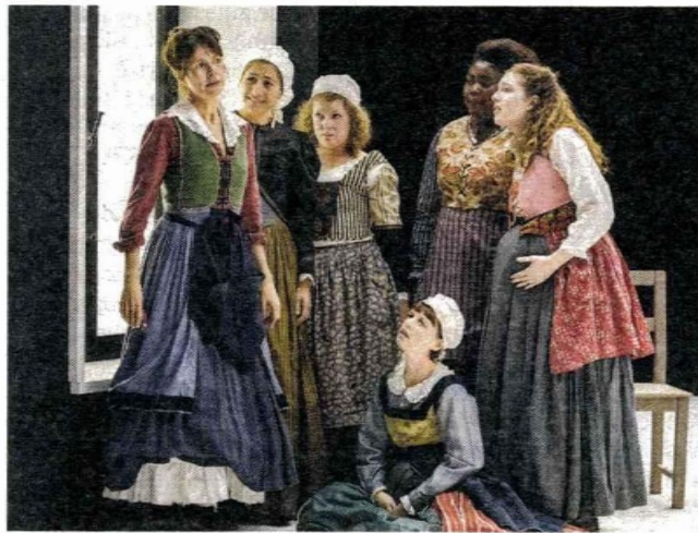
Le Firmament À partir du 8 jan., au Théâtre du Rond-Point.