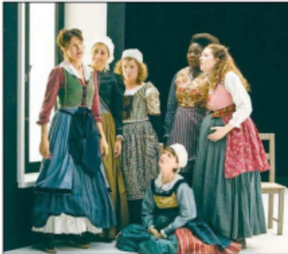
Douze femmes soustraites à leur quotidien font jury populaire pour décider de la vie ou de la mort d'une troisième.