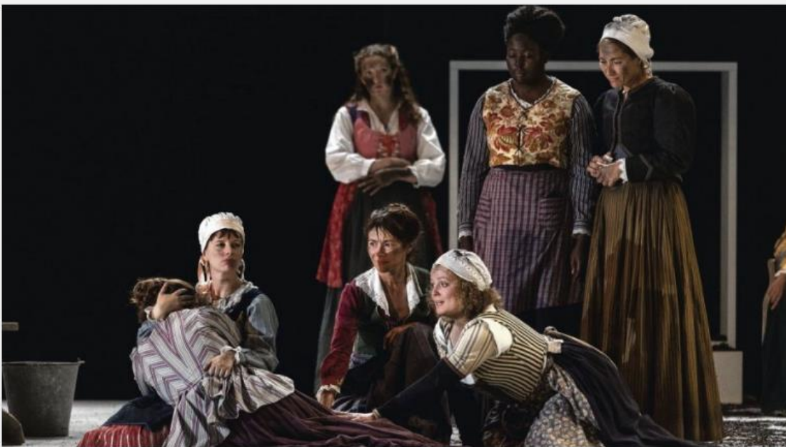
La mise en scène est conçue comme un tableau de maître à la Vermeer qui soudain prendrait vie.

Publié le Dimanche 26 février 2023 - Marie-José Sirach