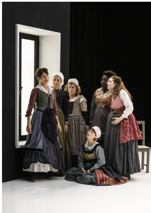
« Le Firmament », de Lucy Kirkwood, mis en scène par Chloé Dabert, au Centquatre, à Paris, le 27 septembre 2022. VICTOR TONELLI

Par Fabienne Darge (Reims (Marne), envoyée spéciale)