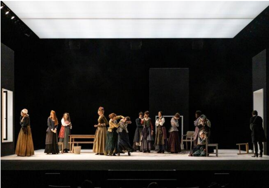
Agrandir l'image Scène de "Le firmament"