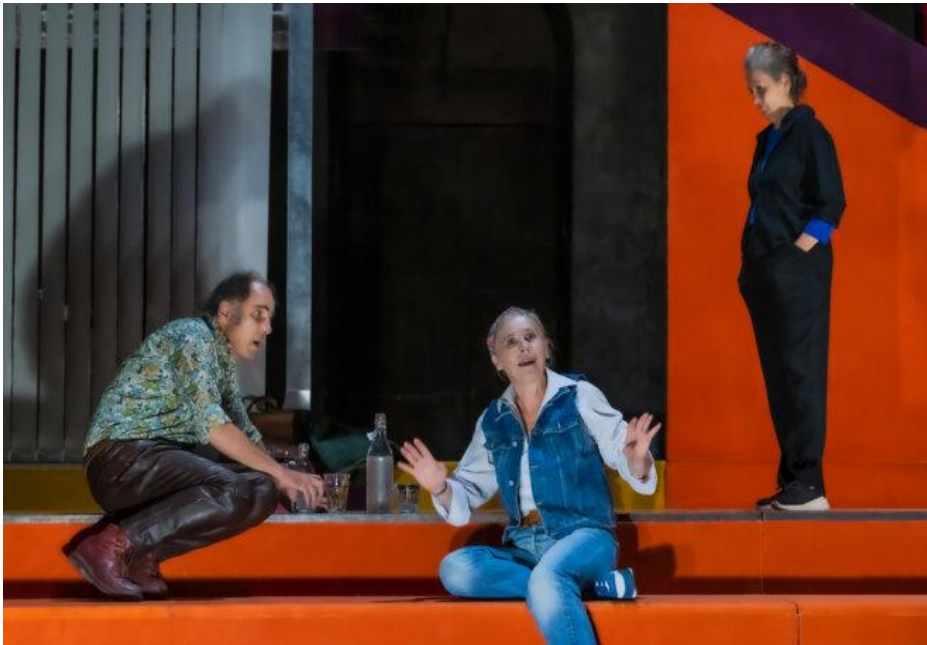
Agrandir l'image scène de "Les enfants"