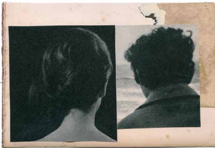
Katrien De Blauwer, Les photos qu'elle ne montre à personne éditions Textuel

Simone de Beauvoir, La force des choses , volume 2 Gallimard, Paris