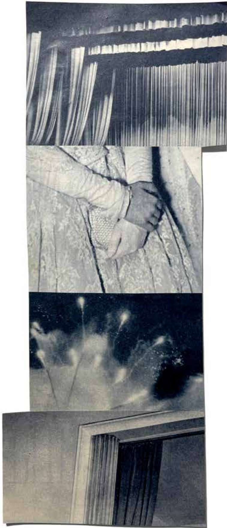
Katrien De Blauwer Les photos qu'elle ne montre à personne éditions Textuel